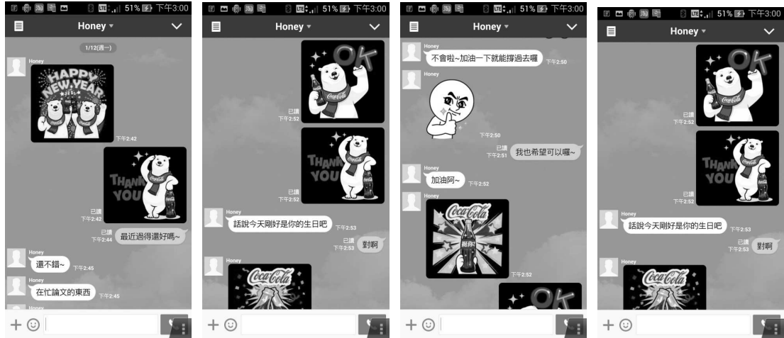
圖 4：貼圖情境對話 1